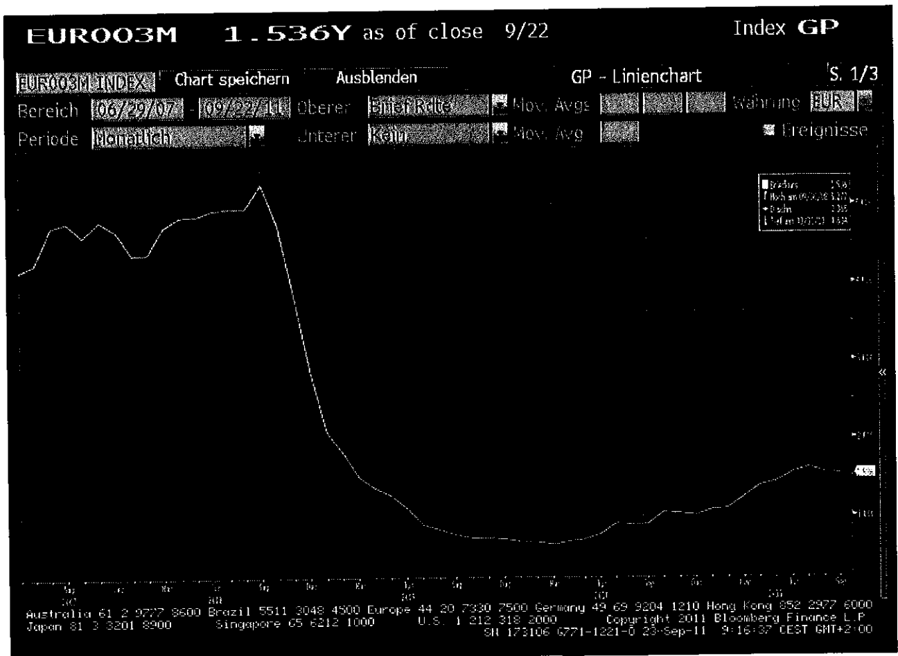
Chart des Referenzsatzes

Der EURIBOR (Euro Interbank Offered Rate) ist ein für Termingelder (Termineinlagen, Festgeld) in Euro ermittelter Zwischenbanken-Zinssatz. Die Quotierung dieses Zinssatzes erfolgt durch repräsentative Banken (derzeit 57 Banken, darunter 47 aus der Eurozone, 4 aus sonstigen EU-Ländern und 6 aus Banken außerhalb der EU), die sich durch aktive Teilnahme am Euro-Geldmarkt auszeichnen. Dabei werden die jeweils höchsten und tiefsten Werte eliminiert (je 15 Prozent). Für die Berechnung des EURIBOR übermitteln die Banken die Sätze zu denen eine Bank Kredite anbietet, für Interbankenkredite an den Bildschirmdienst Bridge Telerate nach Brüssel. Bridge Telerate errechnet dann aus den Angaben eine arithmetische Durchschnittszinnsrate, die um 11 Uhr Brüsseler Zeit (MEZ) für die unterschiedlichen Laufzeiten weltweit veröffentlicht wird.