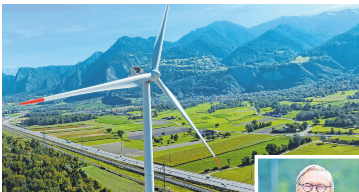
Investitionen in börsennotierte Windkraftunternehmen sind besonders beliebt. VN

Doch wie erkennt man bei Fonds die Nachhaltigkeit dahinter? Als Orientierungshilfe gelten die ESG-