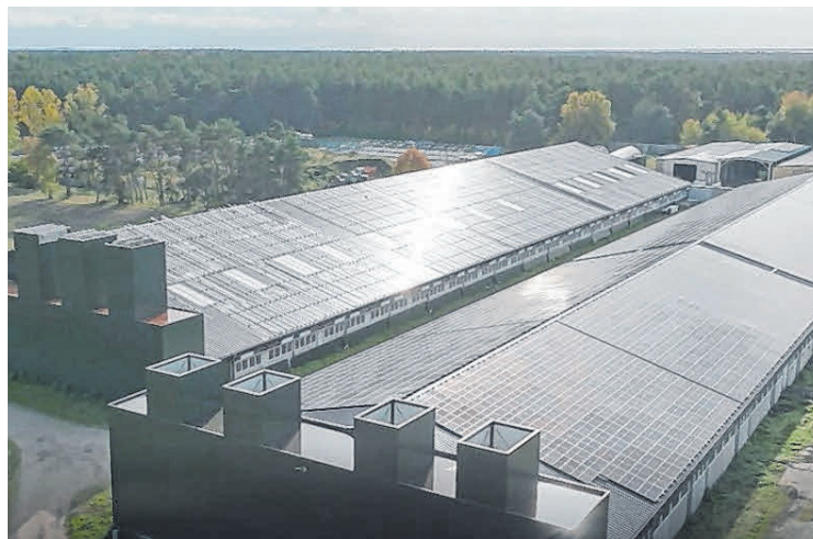
Je mehr Paneele, umso größer die Gefahr, dass das Dach wegfiegt. Aerocompact sorgt für sichere Befestigung und das weltweit.