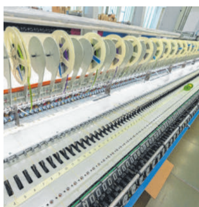
Stickerei-Maschinen können in Vorarlberg immer weniger Menschen bedienen.

Dazu komme, dass sich bei der Suche nach neuem Personal herausgestellt habe, dass immer weniger Menschen in Vorarlberg dazu bereit seien, einen Ganztagsjob anzunehmen. „Viele wollen nur noch